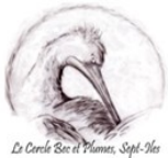
Le Cercle Bec et Plumes, Sept-Îles